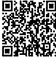
หนังสือที่อ้างถึง