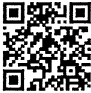
สิ่งที่ส่งมาด้วย

รองอธิบดี ปฏิบัติราชการแทน อธิบดีกรมส่งเสริมการปกครองท้องถิ่น