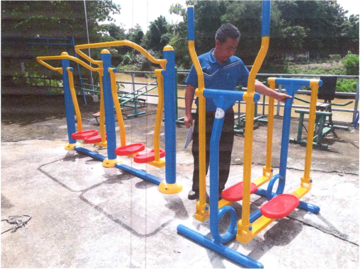
ลานออกกำลังกายหมู่ที่ 1 บ้านปงเจริญ