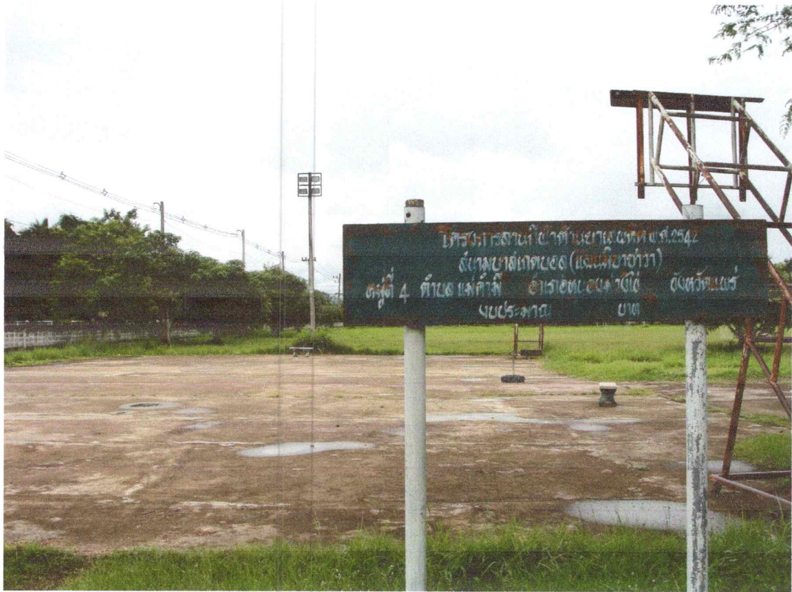
ลานกีฬาหมู่ที่ ๔ โรงเรียนบ้านแม่คำมีรัตนปัญญา