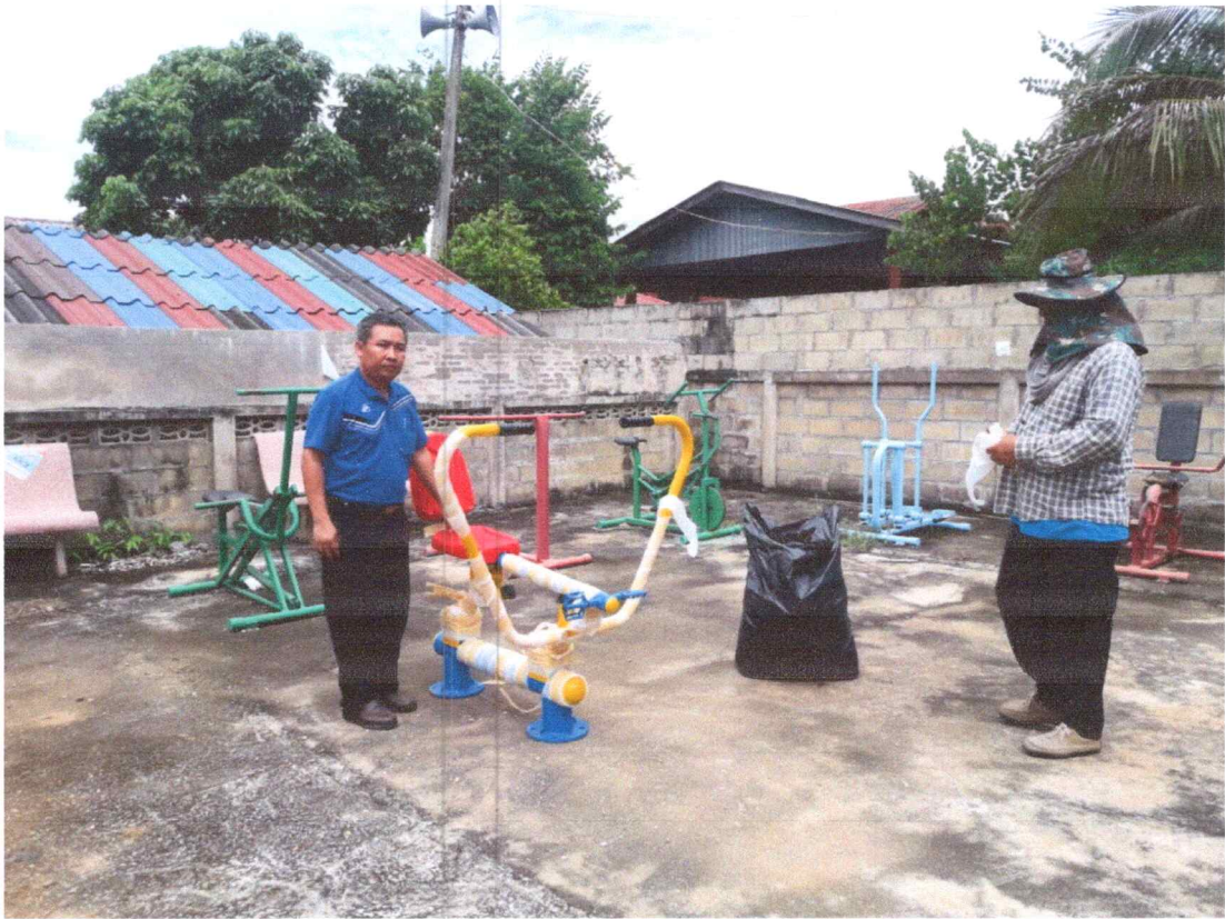
ลานออกกำลังกายหมู่ที่ 3 บ้านรัตนปัญญา